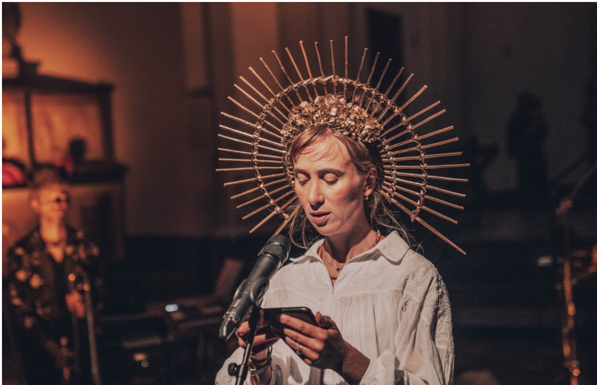
Beeld | Isabelle Renate la Poutré

Een wonderlijke vertelling over de bekendste Moeder ter wereld en haar kinderen